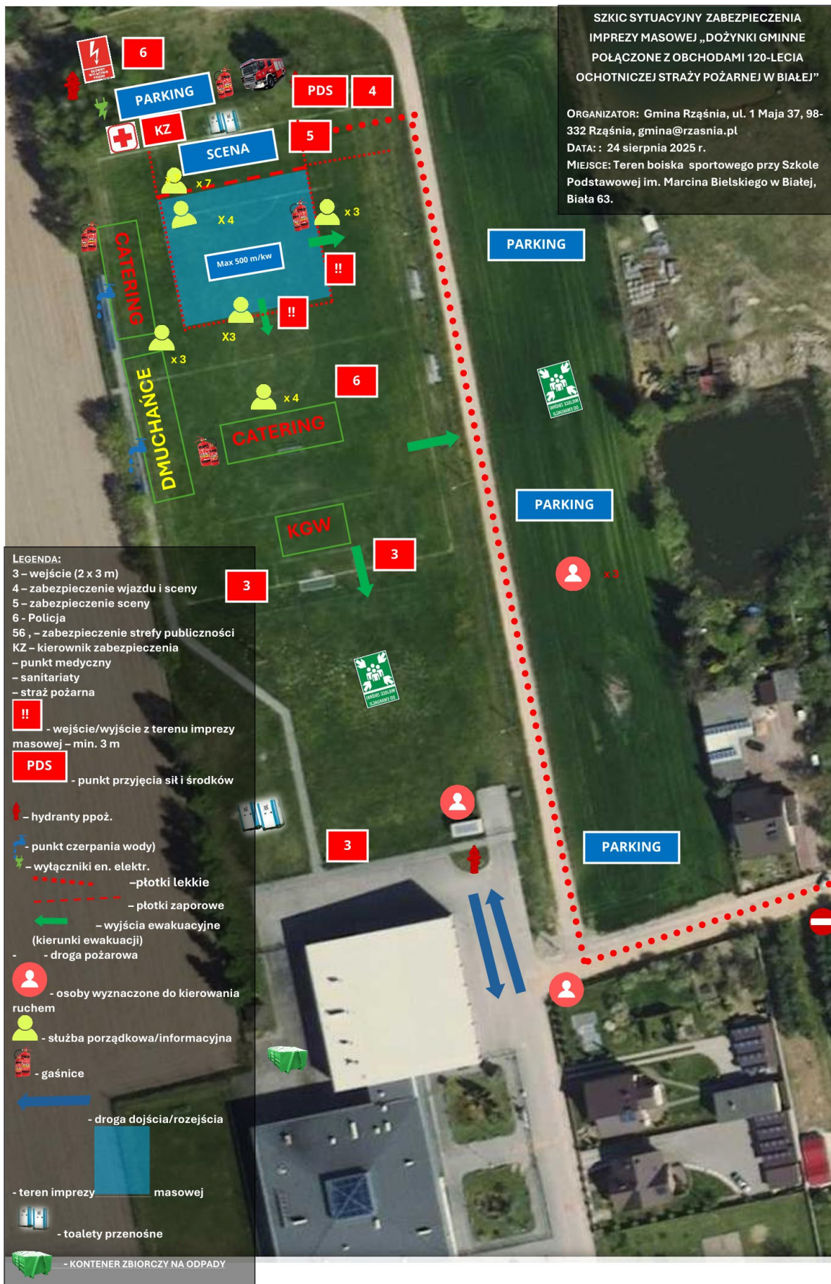
Szkic sytuacyjny zabezpieczenia imprezy masowej pod nazwą “Dożynki Gminne połączone z jubileuszem 120-lecia OSP Biała”