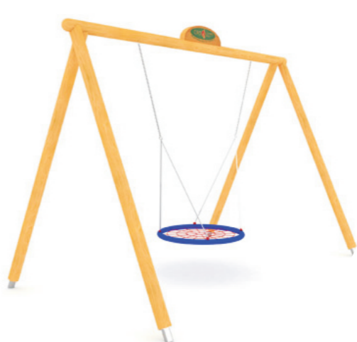
3. HUŚTAWKA BOCIANIE GNIAZDO