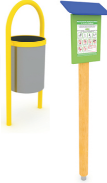
9.TABLICA Z REGULAMINEM