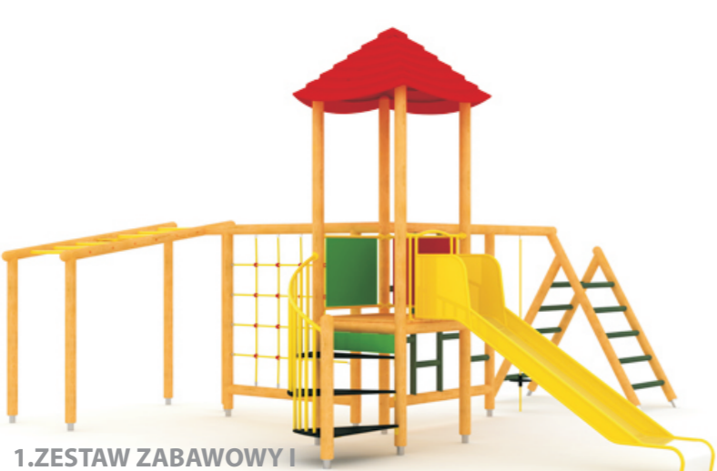
1.ZESTAW ZABAWOWY I