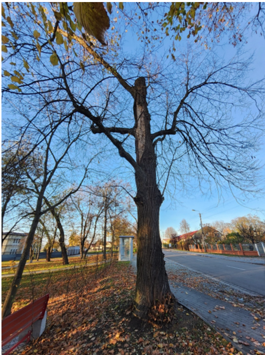
Drzewo nr 1

Załącznik nr 1 do uchwały nr XXII/155/2026 Rady Gminy Rząśnia z dnia 21 maja 2026 r.