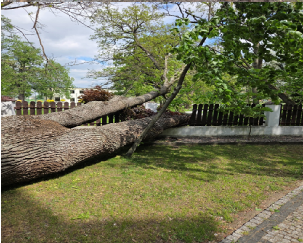
Drzewo nr 2